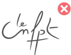
Modifier la construction du logotype

Le logotype CNFPT ne sont pas modifiables ; leurs formes et leurs couleurs sont immuables. Il est notamment interdit de modifier les formes autour Interdits Logotype de la typographie, et il est interdit d'utiliser des versions colorisées ou monochromes avec d'autres couleurs que celles de la gamme définie par cette charte.