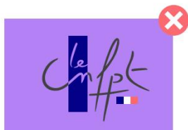
Utiliser le logotype en couleur sur un fond coloré