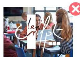
Placer le logotype sur une partie d'un visuel qui n'est pas uniforme