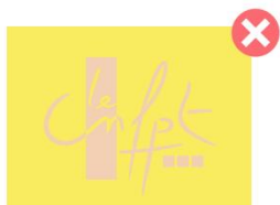
Logotype et fond dans deux couleurs trop peu contrastées