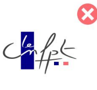
Déformer le logotype