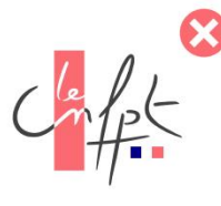
Changer les couleurs du logotype