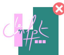
Logotype à cheval sur une forme géométrique