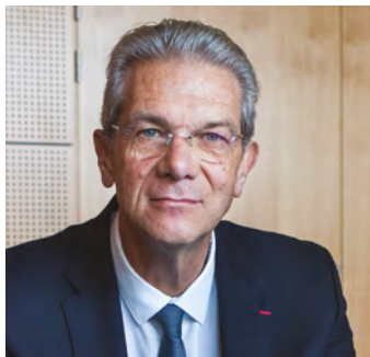
François DELUGA Président du CNFPT

La loi dite « 3Ds » – de sa véritable appellation loi relative à la différenciation, la décentralisation, la déconcentration et portant diverses mesures de simplification de l'action publique locale – a été publiée le 21 février 2022, suite à un accord intervenu en commission mixte paritaire entre le Sénat et l'Assemblée nationale.