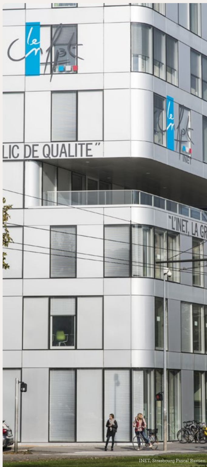
INET, Strasbourg Pascal Bastien

Le service formation continue de l'INET fc.inet@cnfpt.fr