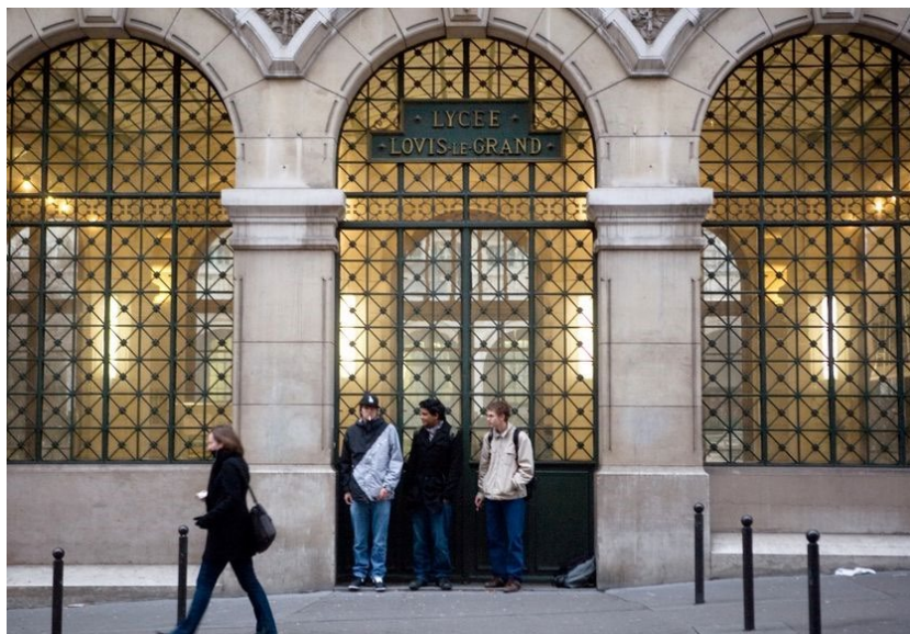
Des étudiants devant le lycée Louis le Grand à Paris.