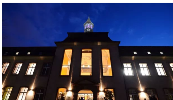
Ecole nationale d'administration, Strasbourg.