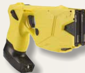
Pistolet à impulsion électrique