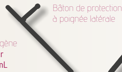
Bâton de protection à poignée latérale