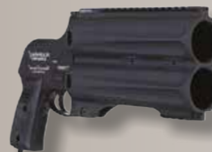
Lanceurs de balle de défense