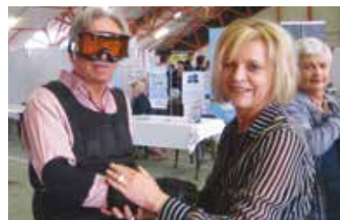
La combinaison-vieillessement a suscité la curiosité

L'objectif de cette journée organisée par le réseau OMEGA 56, était de rassembler les professionnels du secteur gérontologique autour du thème « Améliorer la qualité de vie des personnes âgées à domicile ou en établissement ». Étaient présents : l'association Psychologie et vieillissement de Rennes, l'ADIL, un élu de la ville de Rennes labellisée « Ville aux aînés ». La délégation régionale a présenté la combinaison-vieillessement (marque GERT) et les actions mises en œuvre dans le cadre du conventionnement CNFPT/CNSA : dispositif assistant de soins en gérontologie, accompagnement VAE.