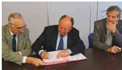
Signature de la convention ARIC/CNFPT/Vannes agglo, avril 2014.

Un cycle de formation destiné aux élus et aux techniciens des services d'urbanisme de Vannes agglo a débuté le 15 mai 2014 et se poursuivra en 2015. Ce dispositif - co-construit avec l'ARIC et les responsables des services d'urbanisme