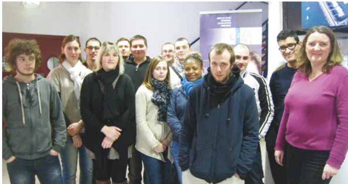
Un groupe de jeunes Morbihannais en contrat d'avenir

438 jeunes ont suivi une formation d'adaptation.