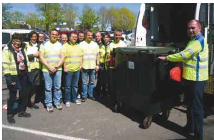
◀ Mise à disposition d'un camion-benne par Vannes agglo pour les formations de 70 rippeurs.