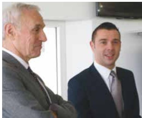
Journée d'actualité organisée par l'antenne du Morbihan ►