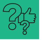
Tableau de bord des actions