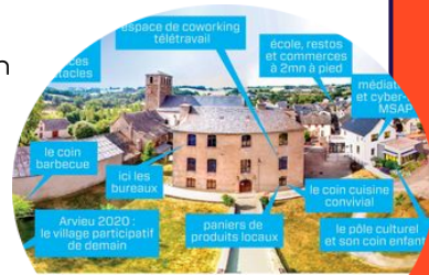
Arvieu, la cité digitale et conviviale en Lévézou