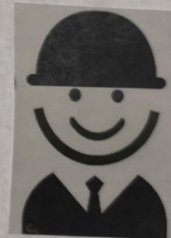
L'ARTISAN DU BOURG